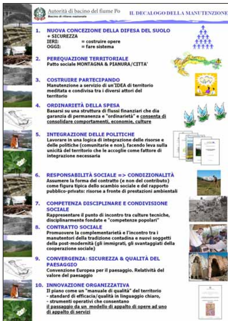
Figura 2 - Il decalogo della manutenzione

un set di parametri-indice, i quali assumono valenze molteplici all'interno della definizione dei diversi profili di cui è composto il piano (ad esempio costituendo il quadro conoscitivo di riferimento o supportando le valutazioni circa la sostenibilità tecnico-economica ed ambientale degli obiettivi di Piano o a supporto del monitoraggio dell'efficacia/efficienza delle azioni manutentive programmate dal piano stesso).