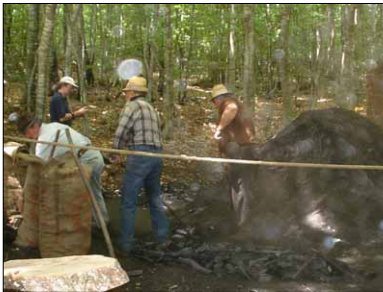
Figura 3 – Rievocazione dell'attività dei carbonai. “La carbonera”, giugno 2006 Località i Terruzzi, Morfasso (PC)

fondato su principi di partecipazione attiva e co-pianificazione tra i soggetti pubblici e privati interessati, a diverso titolo, alle attività di manutenzione, attraverso la progettazione di un percorso che individui gli attori li coinvolga nella condivisione di criticità e obiettivi sostenibili;